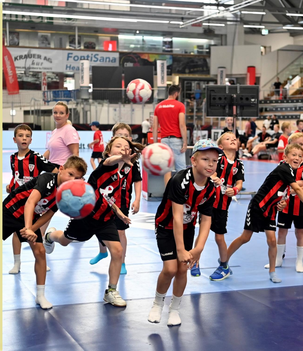
IMAGE DE HANDBALL DE L'ANNÉE, FAIRE DES GÂTEAUX